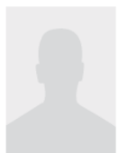
N.N. Telefon 069 6603-1169